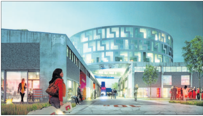
Vinderprojektet til Rockmagnet kan sammen med de øvrige forslag ses i Musicon Art Gallery og på Roskilde Universitetsbibliotek i denne måned.